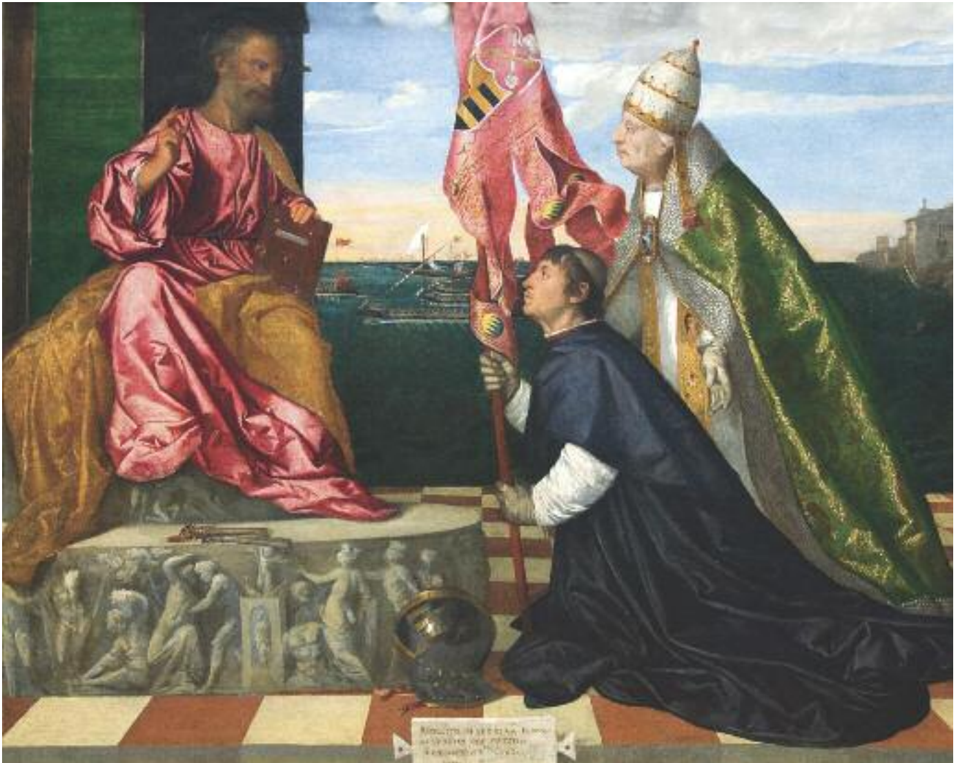
Titiaan Vecellio; Jacopo Pesaro bisschop van Paphos voorgesteld door paus Alexander VI Borgia aan de heilige Petrus; 16 de eeuw | 206 x 168 cm | olieverf op doek | Koninklijk Museum voor Schone Kunsten Antwerpen (KMSKA)

Zelf nam hij het niet te nauw met de zeden. Voor de paus eerder ongebruikelijk had hij 10 erkende kinderen. Er wordt van hem ook verteld dat hij de enige paus is die tegelijk het bed deelde met de moeder en de dochter Lucretia Borgia. Berucht was ook de orgie die hij samen met zijn zoon Cesare organiseerde en waarop tot groot jolijt van de aanwezigen 50 naakte prostituees deden alsof ze varkens waren en in de grond kastanjes zochten. Cesare was trouwens zijn nieuwelingszoon: op 16-jarige leeftijd werd hij al kardinaal. Niet dat hij zo godsvruchtige was, verre van, maar de inkomsten moesten veiliggesteld worden. Het is diezelfde Cesare die model heeft gestaan voor Machiavelli's meedogenloze vorst. Niet alleen allerlei belastingen en rooftochten maakten de Borgia's rijk. On-